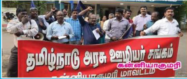
தமிழ்நாடு அரசு ஊழியர் சங்கம் கன்னியாகுமரி கட்சியாளர்கள் மாவட்டம்