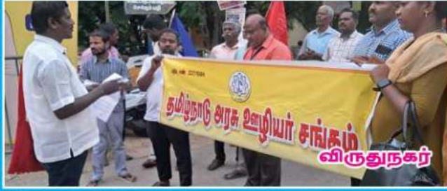
தமிழ்நாடு அரசு ஊழியர் சங்கம் விருதுநகர்