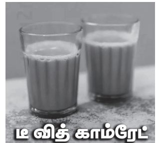
16 வித் காம்ரேட்

அரசுத்துறைதான் என்றில்லை, தமிழகத்தில் இயங்கும் ஐ.டி. துறை எனப்படும் தகவல் தொழில்நுட்பத் துறைகளிலும் பணி நீக்க வேலைகள் நடந்து வருகின்றன. உலகப் பொருளாதார மந்த நிலை என்று காரணம் கூறி தகவல் தொடர்பு நிறுவனங்களில் வேலை பறிப்புகள் தொடர்ந்து நடைபெற்று வருவது அனைத்துத் தரப்பினரையும் குறிப்பாக இளைஞர்களை அச்சமுற வைத்துள்ளது. கடந்த 10 ஆண்டுகளில் 227 பில்லியன் டாலர் வளர்ச்சியையும் 0.45 சதவிகித மில்லியன் வேலைவாய்ப்பையும் கொண்டிருந்த ஐ.டி நிறுவனங்கள் தற்போது உலக அளவில் ஏற்பட்டுள்ள பொருளாதார மற்றும் நிதி நெருக்கடிகளை சமாளிக்க சம்பளம் குறைப்பு மற்றும் வேலை பறிப்பு நடவடிக்கைகளில் இறங்கியுள்ளன. செலவுகளைக் குறைக்கவும், லாப வரம்புகளை பாதுகாக்கவும் விரும்பும் போது அது அரசாங்கமாக இருந்தாலும் சரி, ஐ.டி.நிறுவனங்களாக இருந்தாலும் சரி, அவை பணிநீக்க நடவடிக்கையையே தெரிவு செய்கின்றன. சமீபத்தில் Amazon, CISCO, Twitter, Meta, HP, Alphabet போன்ற நிறுவனங்கள் தங்களது ஊழியர்களில் 6.1 சதவிகிதம் பேரை நீக்கியுள்ளன ஸ்டார்ட் அப் (Start up) நிறுவனங்கள் ஊழியர்களை வேலைக்கு எடுப்பது 61 சதவிகிதம் குறைந்துள்ளது. தமிழகத்தில் இயங்கி வரும் 'வெர்ச்சூசா' போன்ற நிறுவனங்கள் தங்களது ஊழியர்களை எந்தவித முன்னறிவிப்புமின்றி சட்டவிரோதமாக வேலை நீக்கம் செய்துள்ளன. நூற்றுக்கணக்கான தமிழக மென்பொறியாளர்கள் இளம் வயதிலேயே வேலையிழக்கும் அவல நிலை ஏற்பட்டுள்ளது. தொழிலாளர் நலச் சட்டங்களை ஐ.டி. நிறுவனங்கள் முழுமையாக