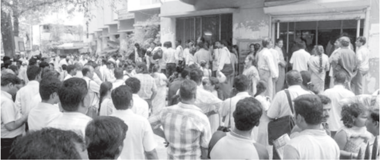
வேலை வாய்ப்பு அலுவலகத்தில் பணிக்காக காத்திருக்கும் இளைஞர் பட்டாளம்

எனவே தமிழக அரசின் “பணியாளர் சீரமைப்புக் குழு”வினை (Staff Rationalization Committee) கலைத்துவிட்டு தமிழகத்தின் வேலை வாய்ப்பு அலுவலகங்களில் வேலை கோரி பதிவு செய்துள்ள வாலிபர்களுக்கு பணிப் பாதுகாப்புடன் கூடிய வேலை வாய்ப்புகள் வழங்கிட வலியுறுத்தியும், அரசு துறைகளில் சமூக பாதுகாப்பற்ற வேலை நியமனங்கள் செய்திடுவதை தடுத்திடவும், தமிழக அரசு ஊழியர்களும், இளைஞர்களும் கைகோர்த்து அரசின் வஞ்சக முயற்சிகளுக்கு எதிராக போராட்டக் களம் காண வேண்டிய தேவையை காலம் நமக்கு கையளித்திருக்கிறது. ஒன்றுபட்ட போராட்டங்களும், சக்திமிகு பங்கேற்பும் மட்டுமே நம்மிடம் உள்ள ஆயுதம் என்ற நிலையில் அரசு ஊழியர்-ஆசிரியர்-வாலிபர்-மாணவர் என்ற வலிமைமிக்க கூட்டமைப்பை உருவாக்கி, தொடுக்கப்பட்டுள்ள கொடுந்தாக்குதலை முறியடித்திட இளைஞர்கள் முன்வர வேண்டும் என தமிழ்நாடு அரசு ஊழியர் சங்கம் அறைகூவி அழைக்கின்றது. ❖